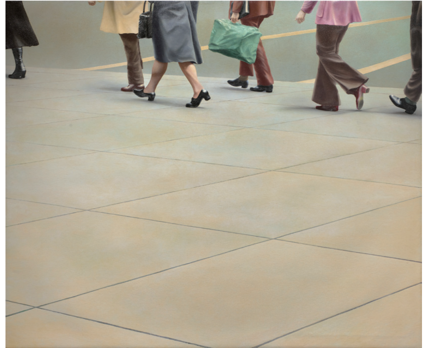
陳昭宏 Side Walk A 1972 布面油畫 203 x 243.8 cm

對陳昭宏而言，繪畫並不是簡單的連續步驟，也不想當然爾就能完成一幅成功的圖像。相反，那是一次探索外在卻又形而上的旅程，它必須與他最內在的某些部分有所連接。《咖啡館》系列如同他的紐約日誌，看到一名外來者在移動中與定點下的城市觀察。咖啡館是每個城市遊蕩者在城市喧囂中的避風港，陳昭宏的許多幅作品聚集在局部、非中心的構圖，或在背景中營造出幾乎是幾何形狀的空間，這點與當時流行的照相寫實主義大異其趣，更著眼在於個人對觀看的選擇與詮釋。陳昭宏薄淡的處理賦予這些形式物理性的溫暖，也使它們更類似攝影當中的浮光掠影，現在看來真是為所謂照相寫實主義增添了極具當代的魅力。但這批作品的魅力並不僅於此，陳昭宏不懈地經營繪畫品質，並且回顧深入在自己血液中的美感，他逐漸又從他的畫中去