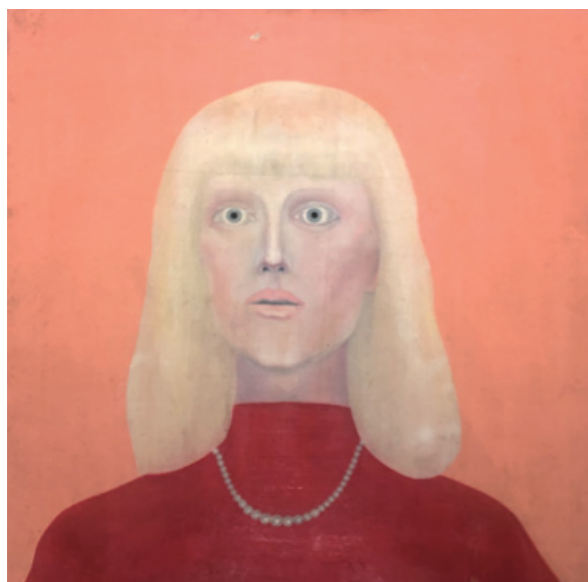
陳昭宏 Patricia 1968 布面油畫 71 x 71 cm

隨即邁入地，就是陳昭宏極具開創性的1970年代。1970年，三件巨大的女人像出現了：〈Queen〉、〈Mother〉、〈Mannequin〉，她們不僅是藝術家最好的畫作之一，也是藝術家最勇敢、最激烈的繪畫陳述。這些畫面，以陳昭宏描繪自己面對女人所認知原始而簡單的形象，直接、直面、驚人地呈現藝術家自己、及所有觀眾面前。像所有的男性畫家一樣，女性既是藝術家的謬思，也一定是痛苦的來源——通過陳昭宏同時帶有幽默、卻又極其震撼的簡單化語