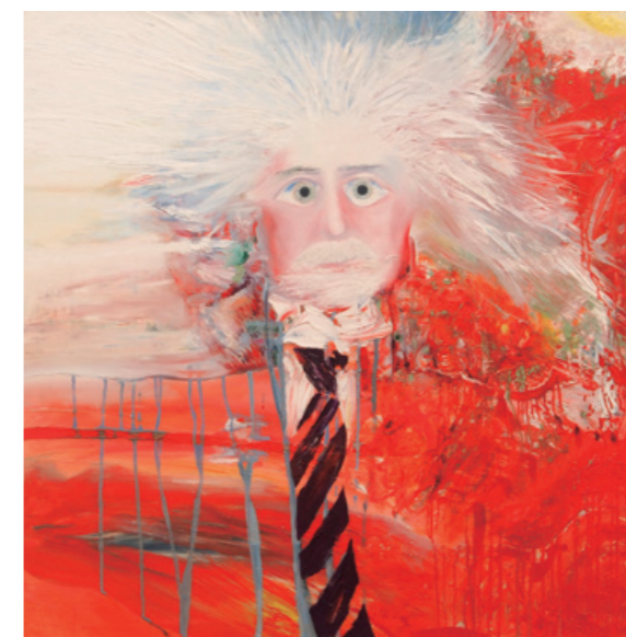
陳昭宏 Relativism 1969 布面油畫 110 x 110 cm