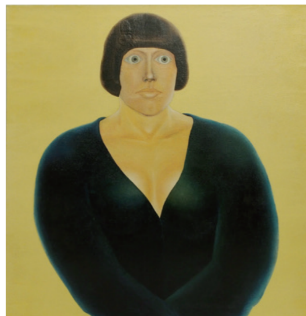
陳昭宏 A Woman 1968 布面油畫 99 x 96.5 cm

自現代藝術起，由具象藝術的練習轉往抽象藝術似乎是多數藝術家的途徑，但先在抽象發展後卻因具象藝術而獲取更大肯定者寥寥可數。陳昭宏便是藝術史上此類相對罕見的成功畫家之一，他的作品在中年經歷了戲劇性的轉變，躍進為一種新的強大風格，就像提香、戈雅、或當代藝術中的古斯頓這樣的大師一樣，最終似乎不僅有意義，甚至超越了以前的所有工作，並在每一個階段進行蛻變。對陳昭宏而言，他的轉向發展是一種必然，也是他自從事藝術創作起的真實志向，而這些出現在1968年至1972年五年之間極具創新性的非抽象作品，與他一位身為旅外藝術家的經歷融合一起，形成了一種新的、原始的、奇怪的、令人不安的、進入他最知名的照相寫實主義之前的表現主義。