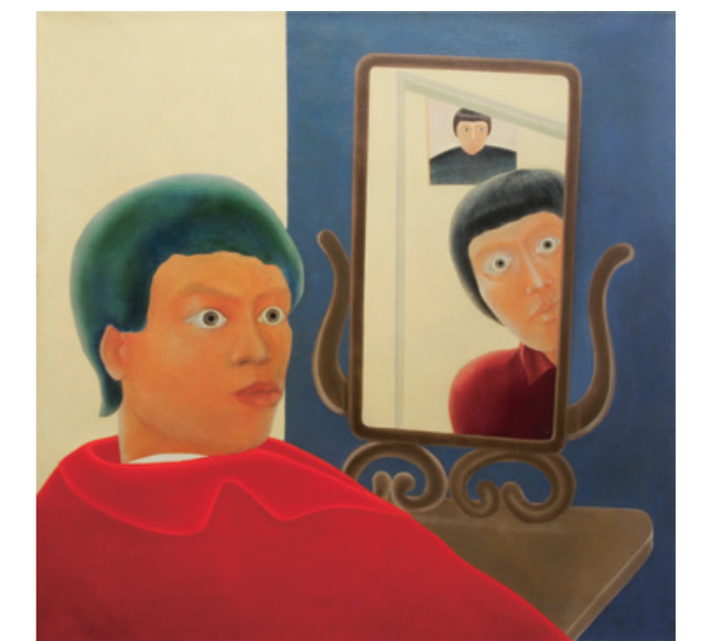
陳昭宏 Self-portrait 1969 布面油畫 127 x 127 cm