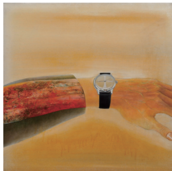
陳昭宏 Hand 1969 布面油畫 66 x 66 cm