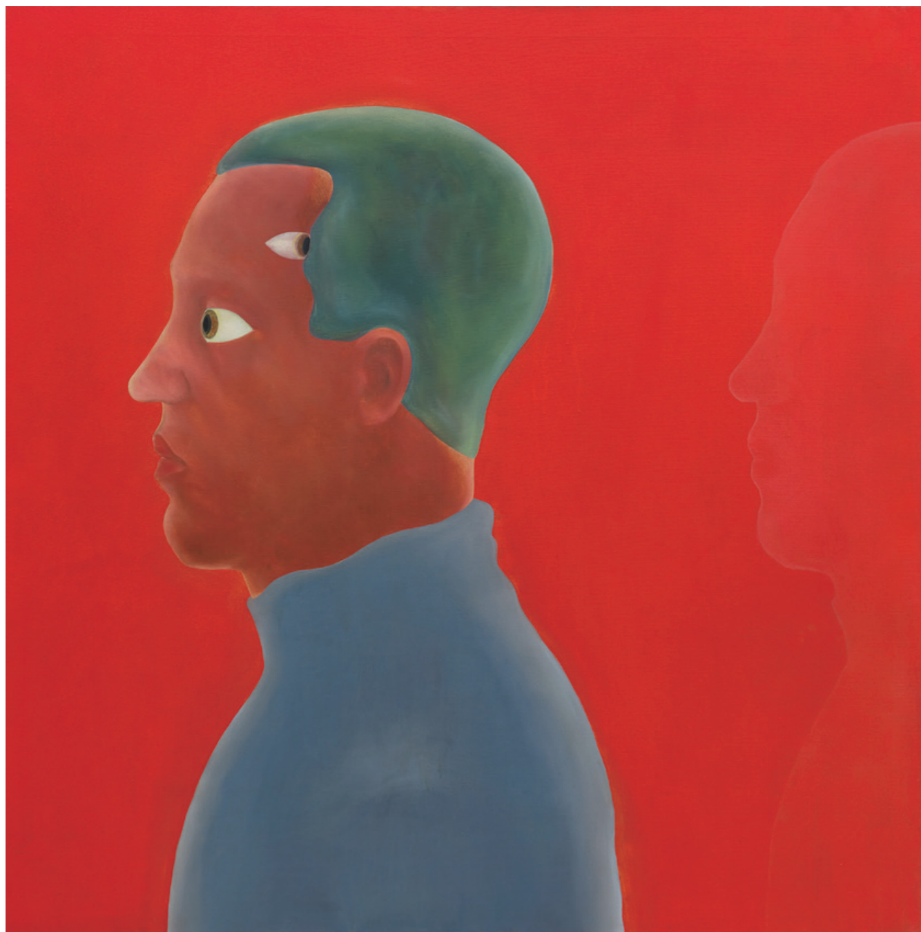
陳昭宏 無題 1969 布面油畫 110 x 110 cm