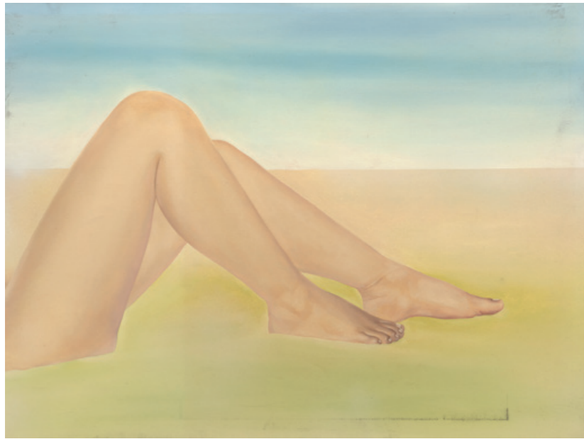
陳昭宏 Beach 1972 布面油畫 183 x 137 cm