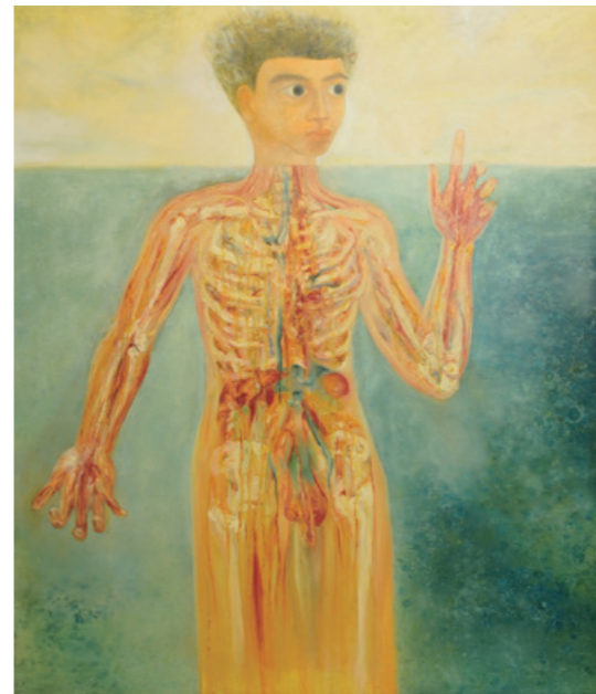
陳昭宏 A Friend 1969 布面油畫 127 x 111.8 cm