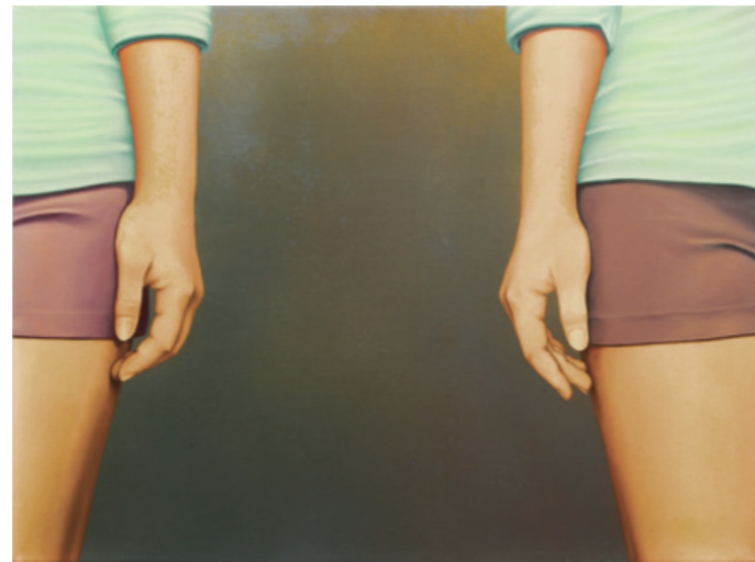
陳昭宏 Twins A 1972 布面油畫 101.6 x 137 cm

言，令人信服地明白男性藝術家的內在折磨。同年完成的〈Hasheesh〉、〈Two of Her〉繼續了這個主題。1971年，以兩年間在紐約拼命從事建築設計而累積下來的資產，陳昭宏在蘇活區租下了第一個工作室，全力投入創作。這個身份上的轉換，也連接到他發自內心的創作脈絡，「我終於可以用自己的眼睛看世界」——一位離開台灣、終於獲得精神上、表現上自由的藝術家的肺腑之言。也因此，他開始有餘力走入紐約這個城市，開啟了他照相寫實主義的創作之路。