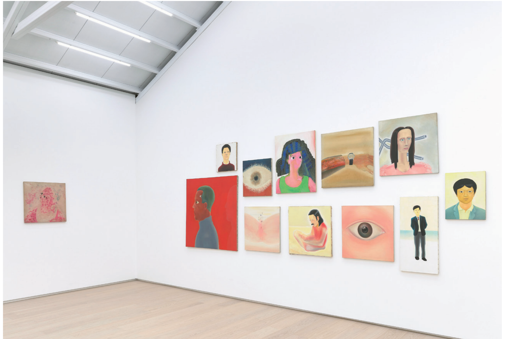
【陳昭宏：眼睛】2021年於亞紀畫廊展出場景

歷經半個世紀，陳昭宏的藝術定義了兩件事情：二十世紀最重要的藝術運動——照相寫實主義的發展，以及他個人——一名海外華人藝術家在藝術商業與藝術內涵上的發展。陳昭宏在他由實驗前衛到光彩奪目的圖像中，出人意料地傳達了複雜的心理學和社會學敘事，最後〈海灘〉的古銅色比基尼身體擁抱酷炫的自由解放，向觀眾展示了席捲美國的社會變化，即使今日，這些作品代表了我們觀看的精神、性感的70年代、以及在動盪的美國社會中一名華人藝術家的極高成就。