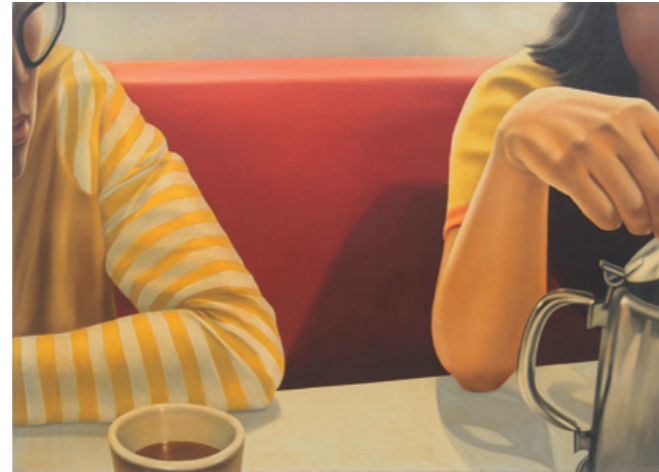
陳昭宏 Coffee Shop A 1972 布面油畫 91.5 x 127 cm