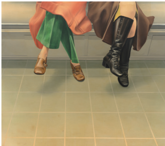
陳昭宏 Two Ladies in the Train 1972 布面油畫 203 x 228.6 cm