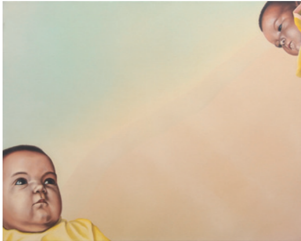
陳昭宏 Two Babies 1972 布面油畫 101.6 x 127 cm