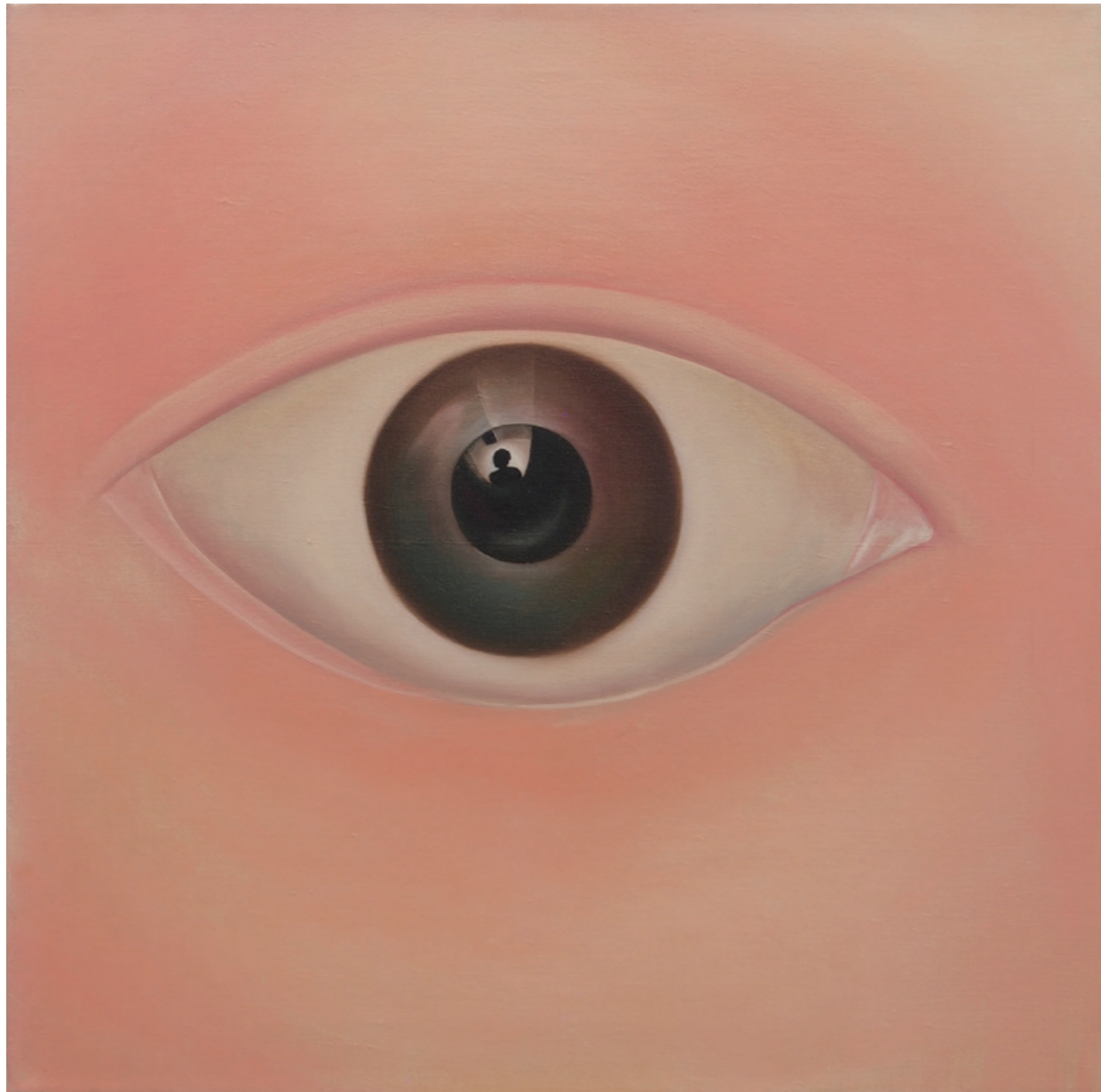
陳昭宏 眼睛 Eye 1969 布面油畫 61 x 61 cm