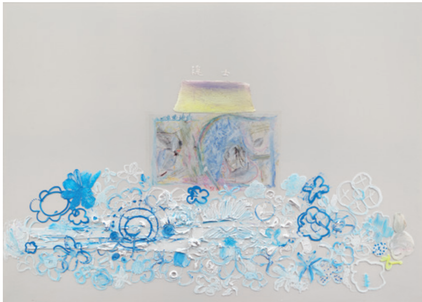
許炯 Xu Jiong, 隱士 Hermit, 2014 – 2019, 壓克力顏料複合媒材 Acrylic pigment mixed media, 150 x 210 cm