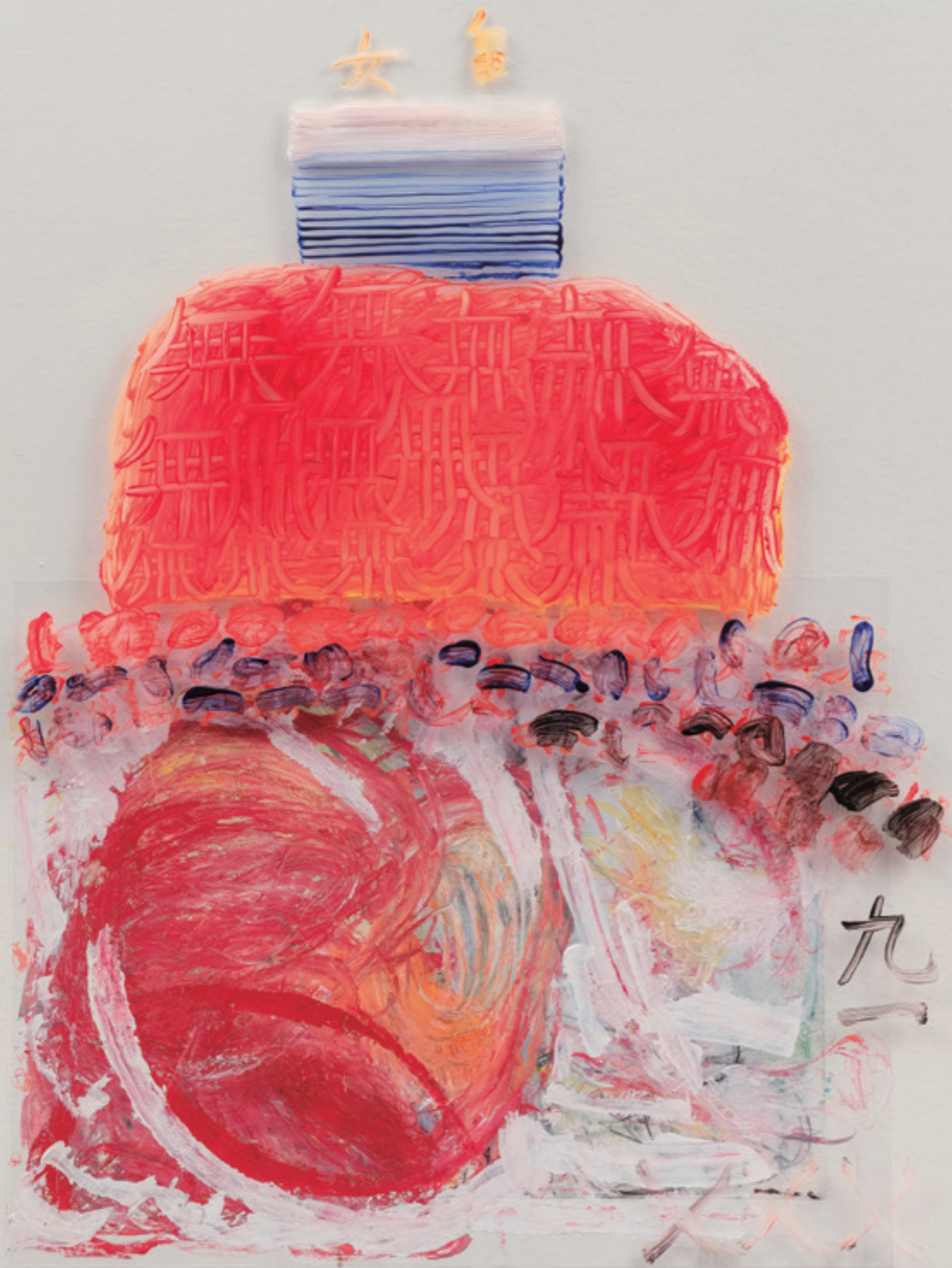
許炯 Xu Jiong, 女皇 Wu, 2014 – 2019, 壓克力顏料複合媒材 Acrylic pigment mixed media, 110 x 150 cm (局部)

原因在於，天秤座的個性，能夠讓他在當藝術家的同時，擅長不斷挑剔自己、超越自己，還有滿意被人圍繞讚美的得意。