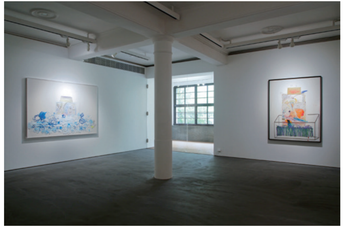
「許炯：自畫像」於亞紀畫廊展出風景 Xu Jiong: Self-Portrait installation view at Each Modern, Taipei

尤其在2015年【萬物想】展覽時，他曾經也嘗試以自己一件舊作來重新加以再創，那個時候這件作品受到很大的鼓勵。因為，鮮少有藝術家願意將自己的舊作拿出來，不管是單獨展出或與新作並陳。這讓他愈加認為，我既然是這樣的我，那我就更應該去面對這樣的我。