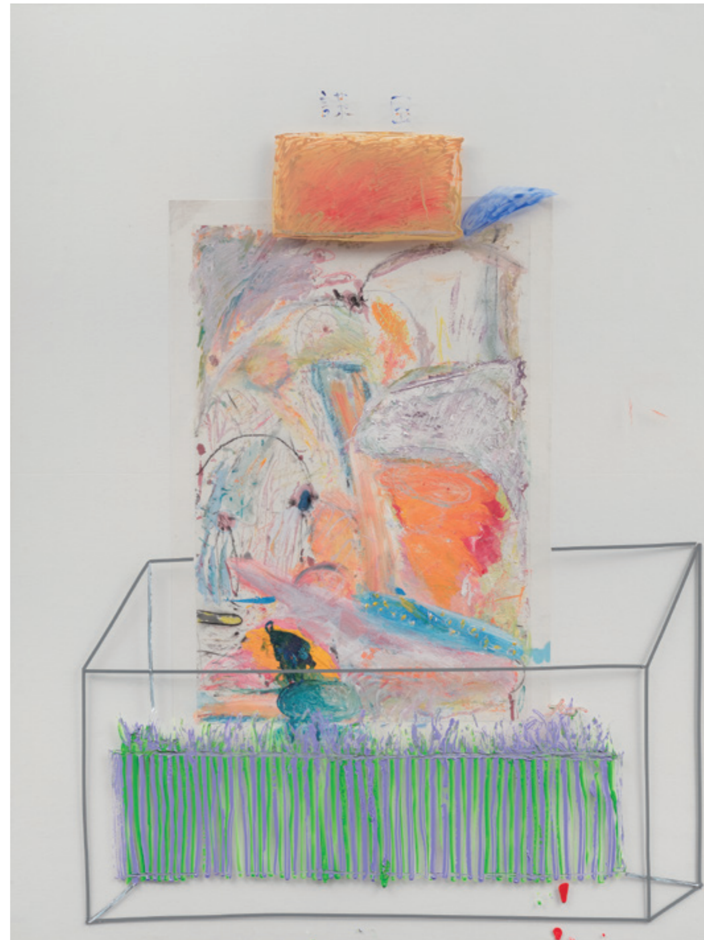
許炯 Xu Jiong, 謀臣 Counsellor, 2014 – 2019, 壓克力顏料複合媒材 Acrylic pigment mixed media, 170 x 128 cm