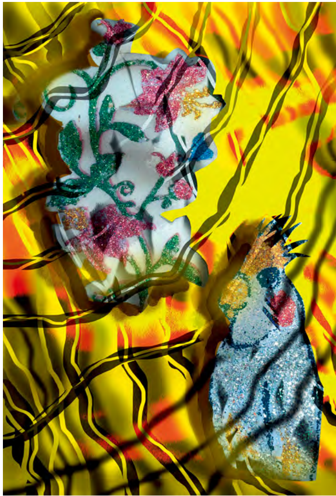
吴美琪,《黄金披萨屋》, 2023, 热转染于缎布, 115x78厘米