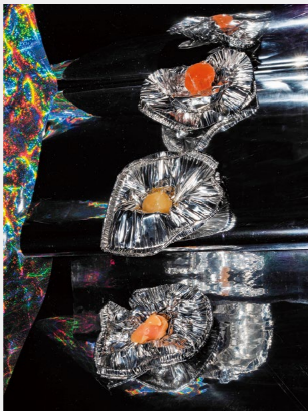
YXX-The Flares #4 2019 熱轉染金屬成像 Dye sublimation print on aluminum 115 x 86 cm

丹麥超現實主義家威廉·弗雷迪（Wilhelm Freddie）說：「超現實主義既不是風格也不是哲學。而是持續的心理狀態。」經由這些實驗與紀錄，我同時觀察各種人事物，探索和挑戰自我，這樣的創作形式將不斷持續進行。