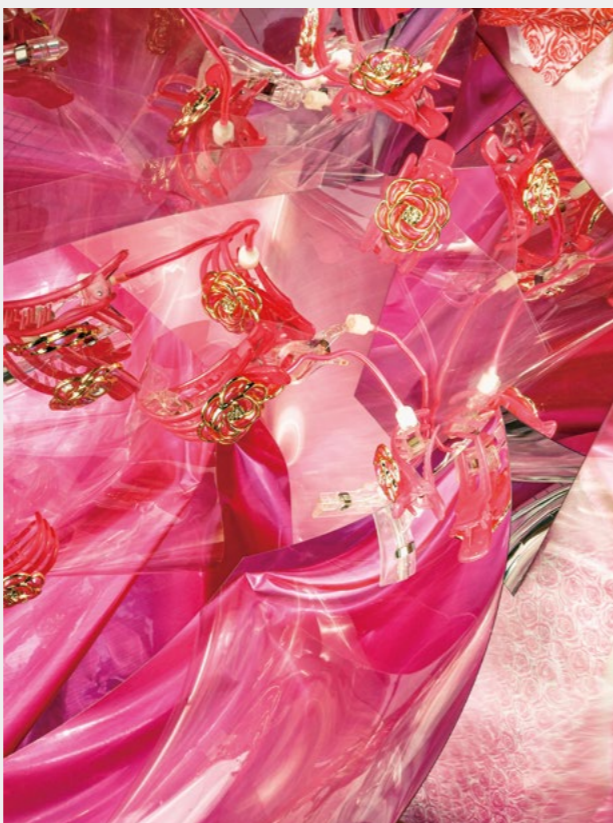
YXX-The Flares #4 2019 熱轉染金屬成像 Dye sublimation print on aluminum 115 x 86 cm