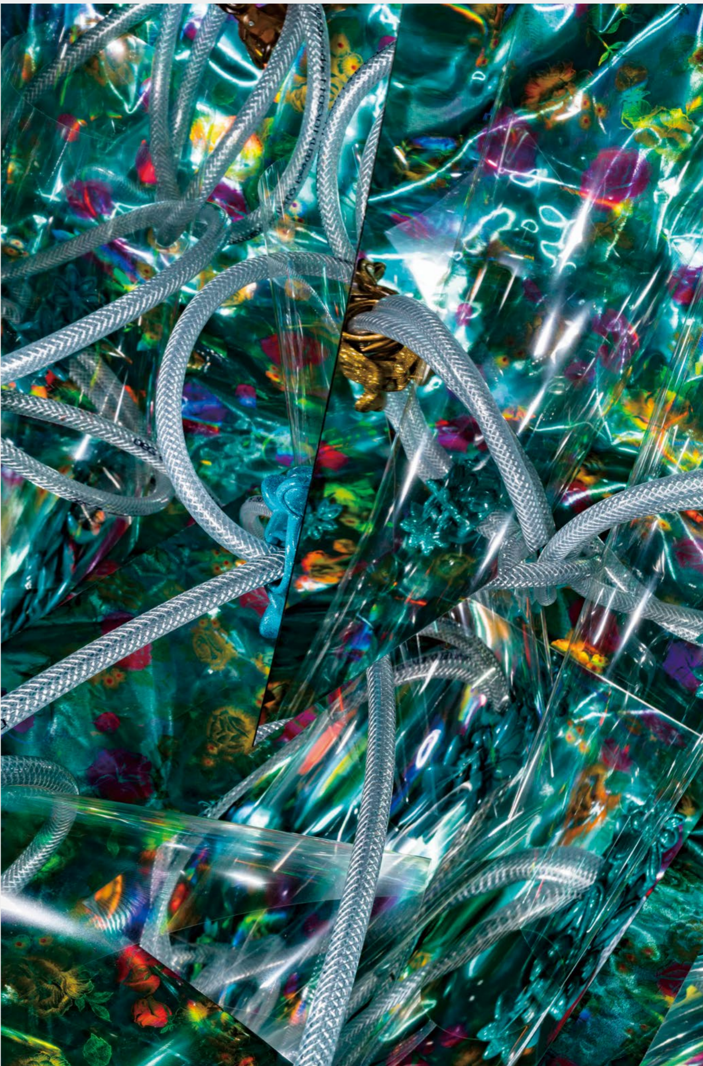
右 / YXX-The Flares #10 2019 熱轉染金屬成像 Dye sublimation print on aluminum 103 x 69 cm