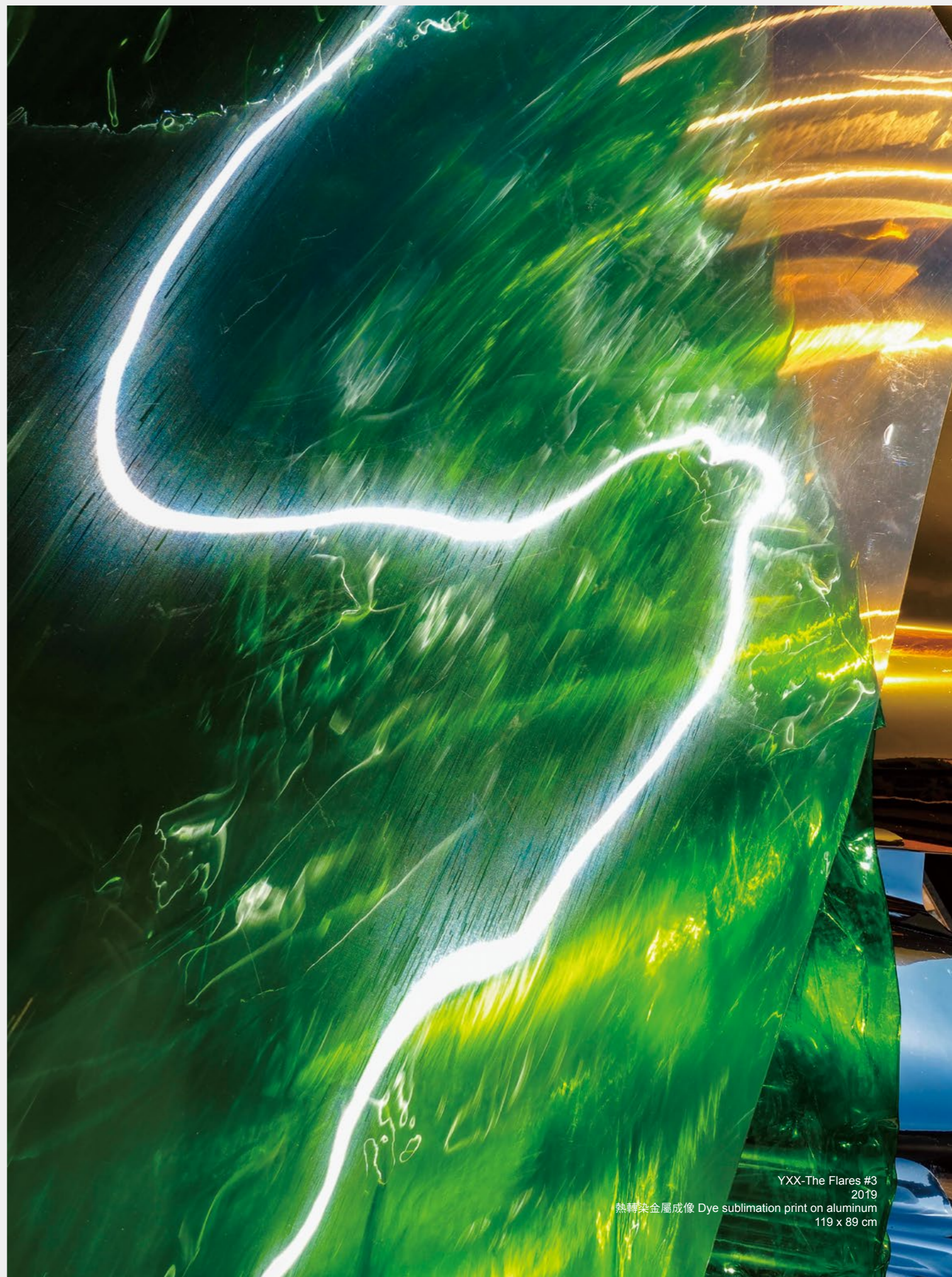
YXX-The Flares #3 2019 熱轉染金屬成像 Dye sublimation print on aluminum 119 x 89 cm