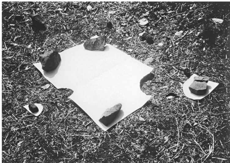
菅木志雄 | 表空 169x54x3cm, 646x34x5cm | /+E -. 0+E, -+ ©K5?B'Dug4,'c8u9D'sy'8f' 4c?'M8; 79D'4D; '38mB'K8y4m4'G4::79y