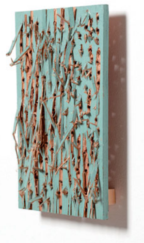
菅木志雄 | 場潛30 木、壓克力顏料 35 x +3/5 x 5'cm +, -- ©K5?B'Dug4,' c8u9D'sy'8f' 4c?'M8; 79D'4D; '38mB' K8y4m4'G4::79y

世代和流派的作品相提並論，這正是菅木志雄的優勢。在兩年前就與代理菅木志雄的小山登美夫畫廊（38mB'K8y4m4'G4::79y）洽談合作展覽，希望透過這次展覽提供觀者對亞洲抽象的統整有一個嶄新的啟發和入口。因此，在規劃上除了呈現藝術家指標之作的同時，選件與放置作品的邏輯也朝向亞洲抽象進行連結，「我覺得這才是非當地畫廊辦展覽的重要意義，如何重新用本地的抽象歷史和外國藝術家既有的脈絡去進行對話，也是我們更關注的面向。」黃亞紀也坦言從藝術史研究的學術脈絡出發，透過華人畫廊的角度去觀看與詮釋日本藝術家的作品，展覽內容在某種程度看來確實也顯得較為嚴肅。