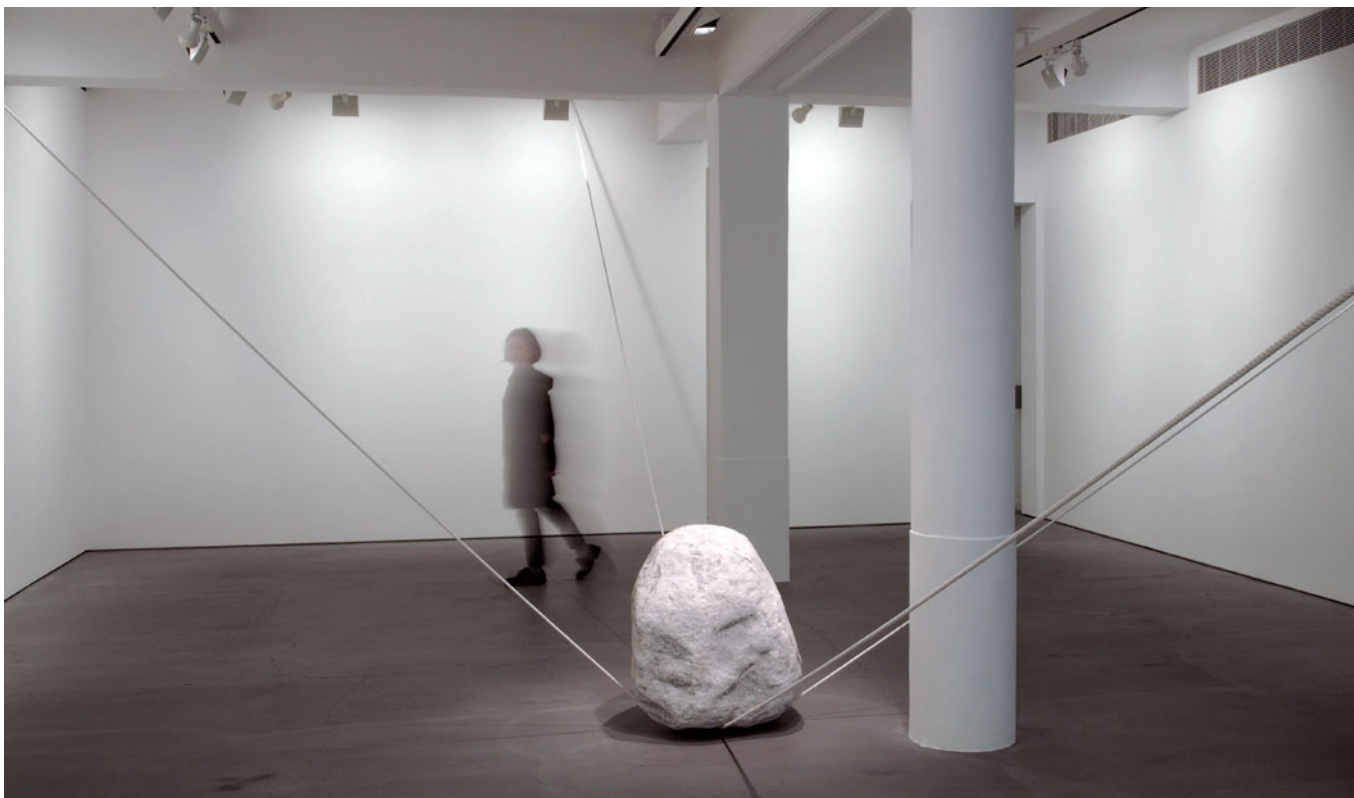
菅木志雄 | 空連化1) M 石、繩 尺寸視場地改變 +, -. ©K5?8'Dug4,'c8u9[7sy'8f] 4c?'M8; 790'40; '38m8'K8y4m4'G4::79y

甫踏入亞紀畫廊呈現的物派藝術家菅木志雄台灣首檔個展「反界結端」，映入眼簾的即是現地創作的經典作品《空連化1) M》，大石與繩索之間的拉扯隱然在空間中產生無形的張力。菅木志雄表示，透過《空連化1) M》的設置使「周圍」與「中心」的界線變得清晰，空間與整體的局面都受到石頭和繩索的制約而集中。同時集約、歸納空間與空間的構成，最後將「大地性」、延展的「空間性」或是所謂的「無限性」，在空間中的成立予以可視化。即使肉眼可見空間周圍是受牆面圍繞，也必須重新感知超越牆面的空間。