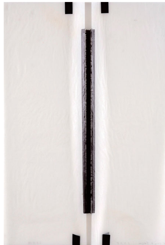
菅木志雄 | 反界結端 紙上乙烯基膠帶與墨 6- × 4+5' cm -.H5 ©K5?B'Dug4,'c8u9Dsy'8f' 4c?' M8; 79D'4D; '38mB'K8y4m4'G4::79y

從現有藝術史研究成果切入，也是亞紀畫廊繼前一檔「中平卓馬：-.H4 至-.0.」之後，接連推出菅木志雄個展的原因。她指出，菅木志雄的創作始終堅守物派理念的深沉哲思，然而即使拿掉物派的頭銜仍是極為出色的藝術家。正因為作品的豐富性與深度足夠，菅木志雄的作品經常在國際展覽中被拿來與不同藝術