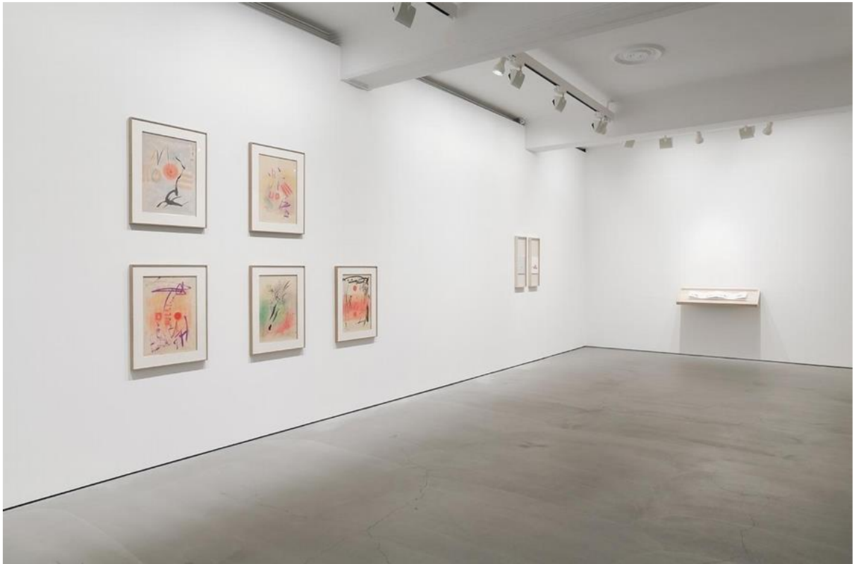
「李元佳與年輕藝術家」1F空間展覽現場。

的上色，但後來仔細檢視，才發現有許多細節是透過暗房的彩色放大機套色而出，這些創作上的點滴與細節，正有待學者與專家進一步的探究。以及，李元佳的所有創作都有編號，包括攝影，這些編號是如何生成？有什麼意義？也有待進一步的解碼。可以說，李元佳基金會藏的手繪照片，也只有基金會擁有。