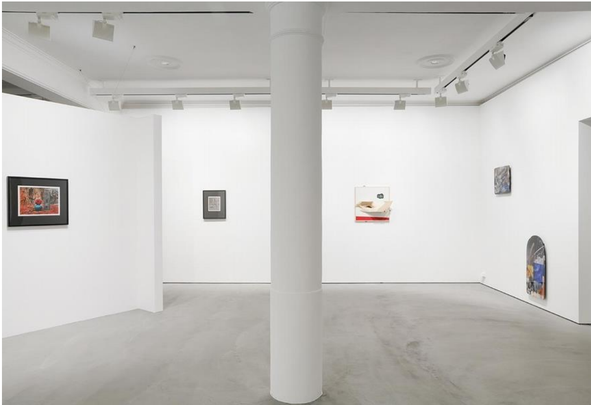
「李元佳與年輕藝術家」2F展覽現場。

李元佳，他的日記裡明確寫著，他對當時國民黨蔣介石集權政府的不滿，他對創作自由的渴望。從廣西到台北，從台北到義大利波隆那，再到英國倫敦，再到北英格蘭的班克斯小村，李元佳一生漂泊。他過往，不曾被認為是英國藝術家，亦不曾在過去20年的亞洲市場裡為人重視。但，這位無國界的藝術家，終究在全球化的今日，被我們發現了。現在英國本土，以探究李元佳美術館暨藝廊為核心的展覽，現正於曼徹斯特美術館（Manchester Art Gallery）展至4月， 展覽名稱為「Speech Acts: Reflection-Imagination- Repetition」 。今年5月，李元佳的攝影展將於曼徹斯特惠特沃思美術館（Whitworth Art Gallery）展出，策展人為2017年威尼斯雙年展威爾斯館策展人瑪麗·格里菲斯（Mary Griffiths）。從這幾年的學術界到收藏市場的李元佳風潮，可以料想，隨著愈來愈多李元佳創作資料的整理與爬梳，這位藝術家的藝術定位，終將出現。