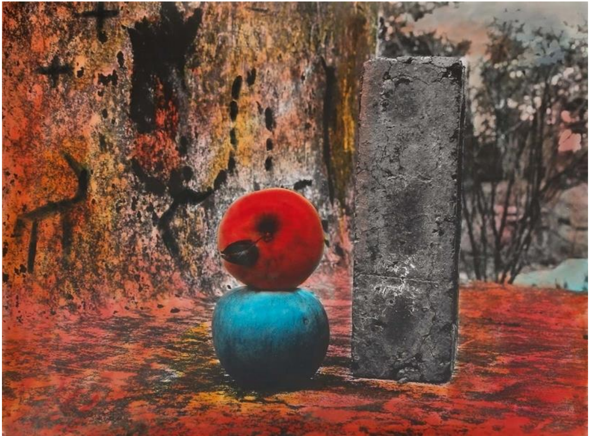
李元佳《Untitled》，手繪黑白照片，30.3 x 40cm，1990初。

品，估計已由倫敦的Richard Saltoun畫廊接手；而李元佳曾被里森畫廊（Lisson Gallery）代理的作品，之後亦已進入泰德美術館館藏。