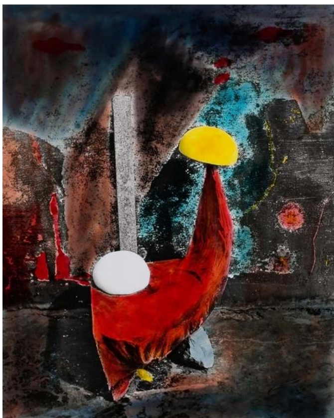
李元佳《Untitled C.1994》，手繪黑白照片，19.9 x 24.5cm。

經過黃亞紀多次前往英國討論合作方案，李元佳在亞紀畫廊的展覽輪廊逐漸浮現，一方面，基金會正加緊腳步修復李元佳的作品，二方面，雙方也針對如何展覽、推廣、銷售有了共識。基金會需要經費修復、研究、保存作品，正可以透過畫廊的串連力量；同樣的，亞紀畫廊的經營路線，在現代藝術大師上，正需要李元佳補上這一塊重要的拚圖。