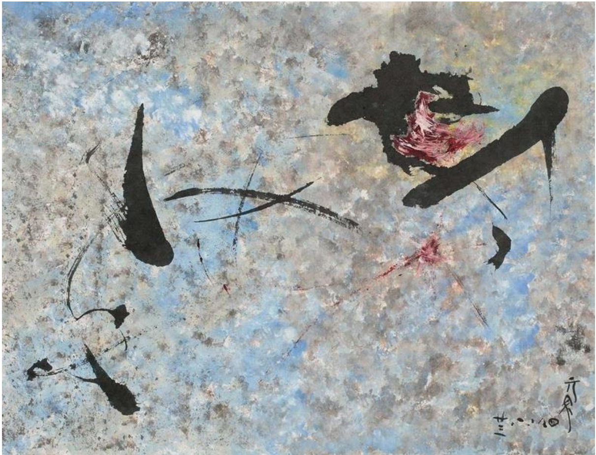
李元佳《Untitled》，紙本水墨油彩、簽名，27.8 x 36.5 cm，1959。（亞紀畫廊提供）

從2014年 北美館「觀·點」回顧展的點火 ，接著亞洲收藏市場開始尋覓華人現代藝術初始的脈絡，再加上西方畫廊大舉進入亞洲，也同步蒐羅亞洲藝術家與西方藝術家在同時期的不同創作交叉脈絡，台灣的東方、五月兩大畫會，是不容錯過的研究對象，而裡頭的傑出藝術家，就在人們的爬梳下，一點一滴的，被人們尋覓而出。李元佳，他恰是這樣一位，有著「神秘」光環的藝術家。他的作品，不容易在市場找到，因為在台灣的作品不是遺失，就是被李元佳帶到義大利。他的作品，幾乎都在歐洲，當年留在義大利的作品，由家具設計師迪諾·葛維納（Dino Gavina）的後代所藏，這批藏