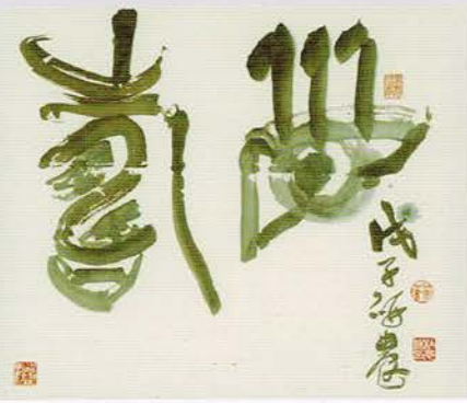
杜忠誥 眉壽 古篆 紙本 62 x 52cm 2008

1933年出生於日本山行縣的細江英公，在學期間即獲學生部最高獎「富士フォトコンテスト」，而後組成「VIVO」攝影團體(1959-1961)，連森山大道都曾任他的助理。細江英公是戰後日本的第一代現代攝影教父大師。作品畫面充斥著神秘、夢幻、超現實，此次個展將展出細江英公著名的作品系列—三島由紀夫的裸體寫真《薔薇刑》、為舞蹈家土方巽拍攝的《鏗詠》及擔任波普教母草間彌生攝影師時期之系列作品等。