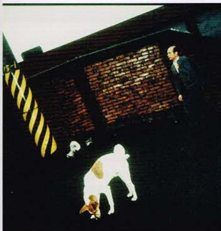
上 / 阮義忠 Juan I-Jong · 〈日本, 1982 Japan 1982〉, 1982, gelatin silver print 下 / 須田一政 Suda Issei · 〈台北街視 Taipei〉, 1990, RP print