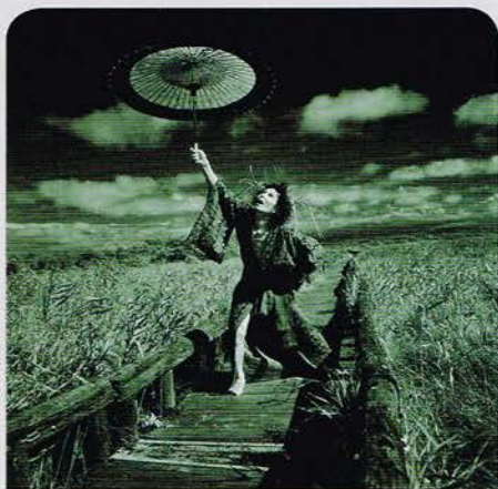
胡蝶の夢：釧路 原で舞う・1994年・20 x 24吋