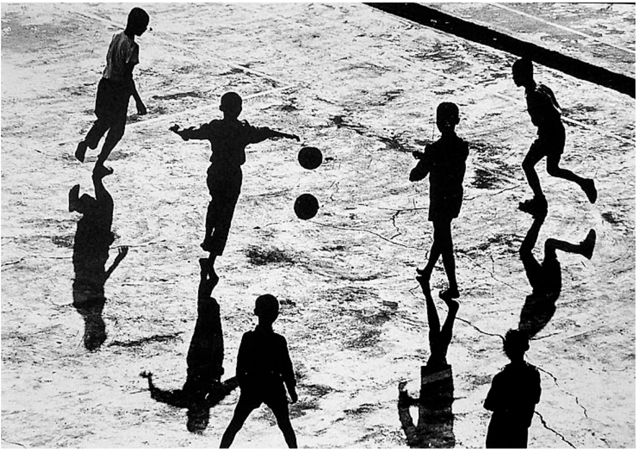
Cheng Shang-His, Playing Ball, 1962

On 10 October 2017, aura gallery taipei will open TAIWAN , an exhibition of vintage photographs and photobooks, shown in cooperation with nitesha, whose book gallery NITESHA BGTP will be launched at its space simultaneously. This exhibition takes both two floors of aura gallery taipei with merely 100 copies of photo magazines and photobooks from 1917, and 15 masterpiece vintages of Taiwan history from 1936.