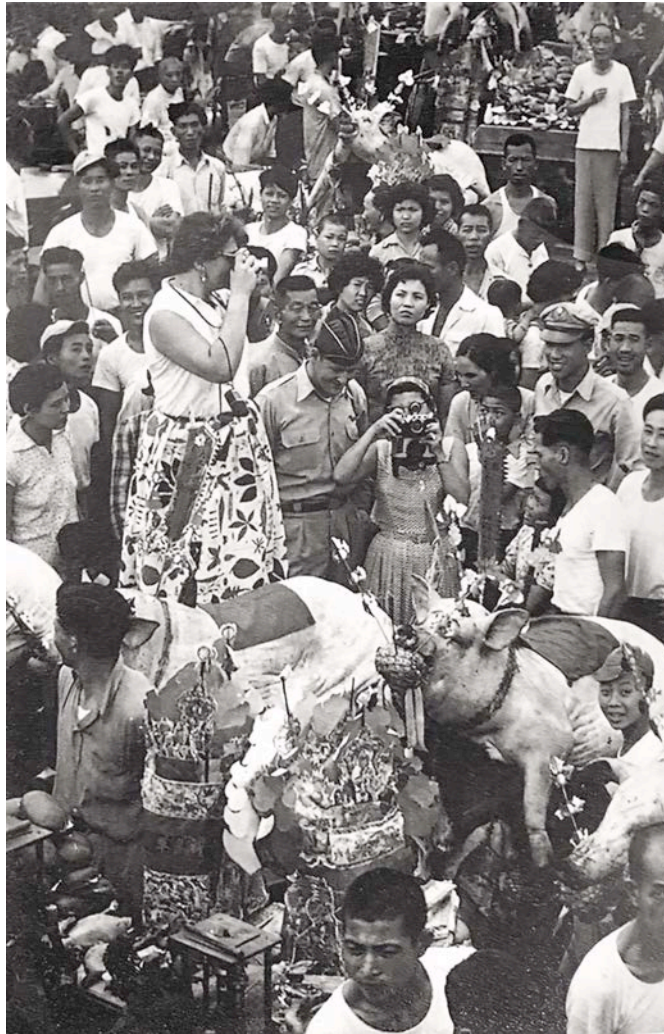
Chang Ts'ai, Untitled, ca. 1940'a